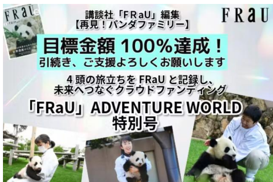
クラウドファンディング企画：

和歌山県南部に位置する白浜町のアドベンチャーワールド。2025年6月に、良浜、結浜、彩浜、楓浜の4頭のパンダが中国へ帰国することを受け、講談社「FRaU」編集の全面協力のもと4頭の旅立ちを記録し、FRaU特集号として未来へ届けるプロジェクトとして立ち上がりました。単に、動物や自然を守るだけでなく、私たち自身が生活のなかで、いのちを大切にする選択、持続可能な選択をしていき、それを未来の世代につなげていこうというメッセージをクラウドファンディングを通して伝えました。